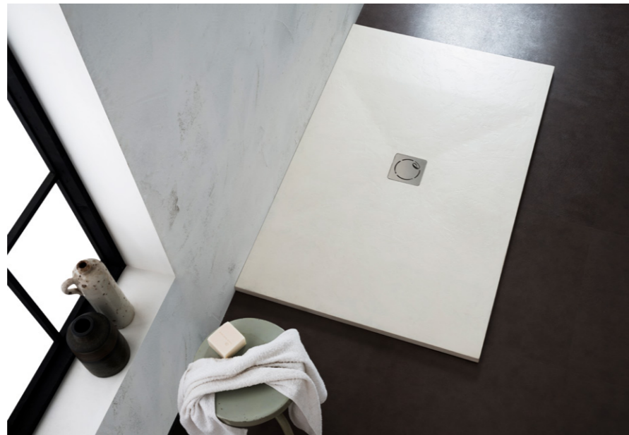
Private House 2015. Italy