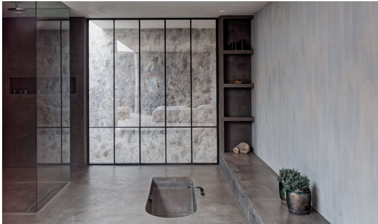
Showroom 2016. Belgium