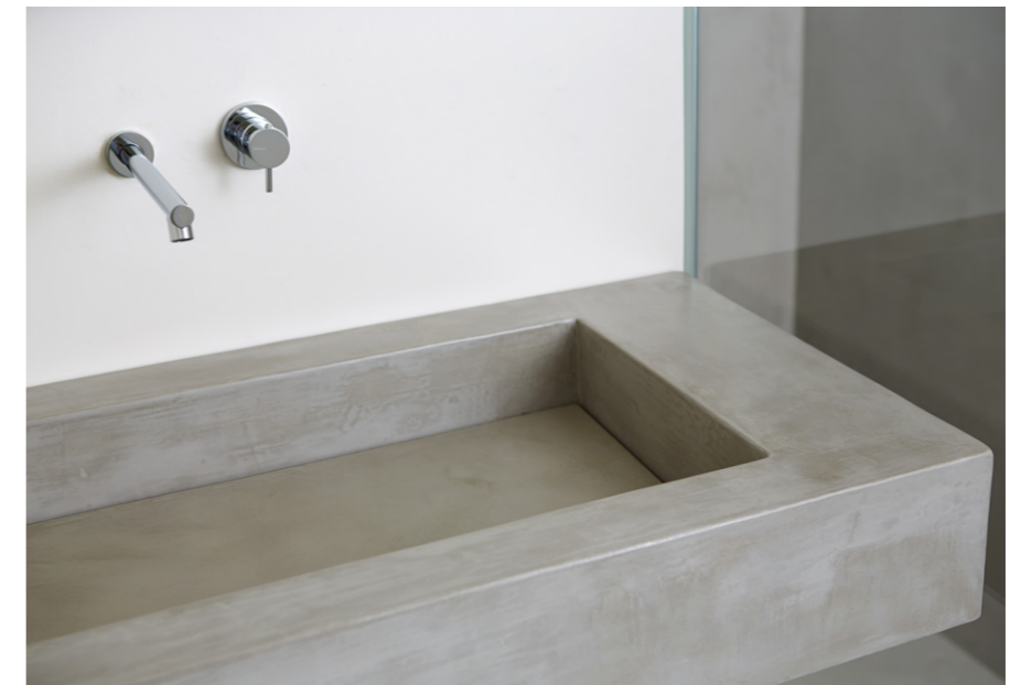
Private House 2016. Northern Italy