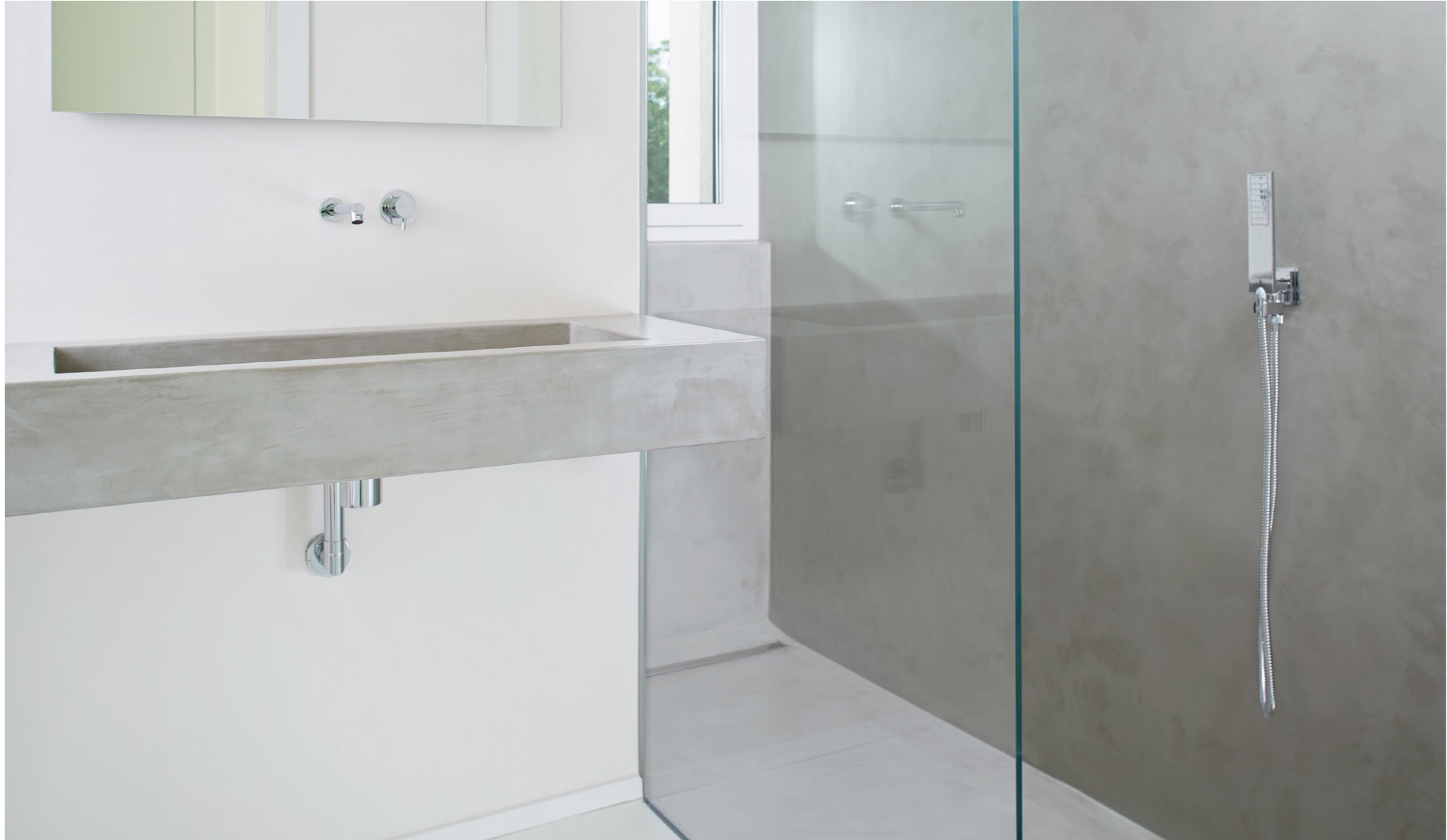
Private Villa 2015. Italy