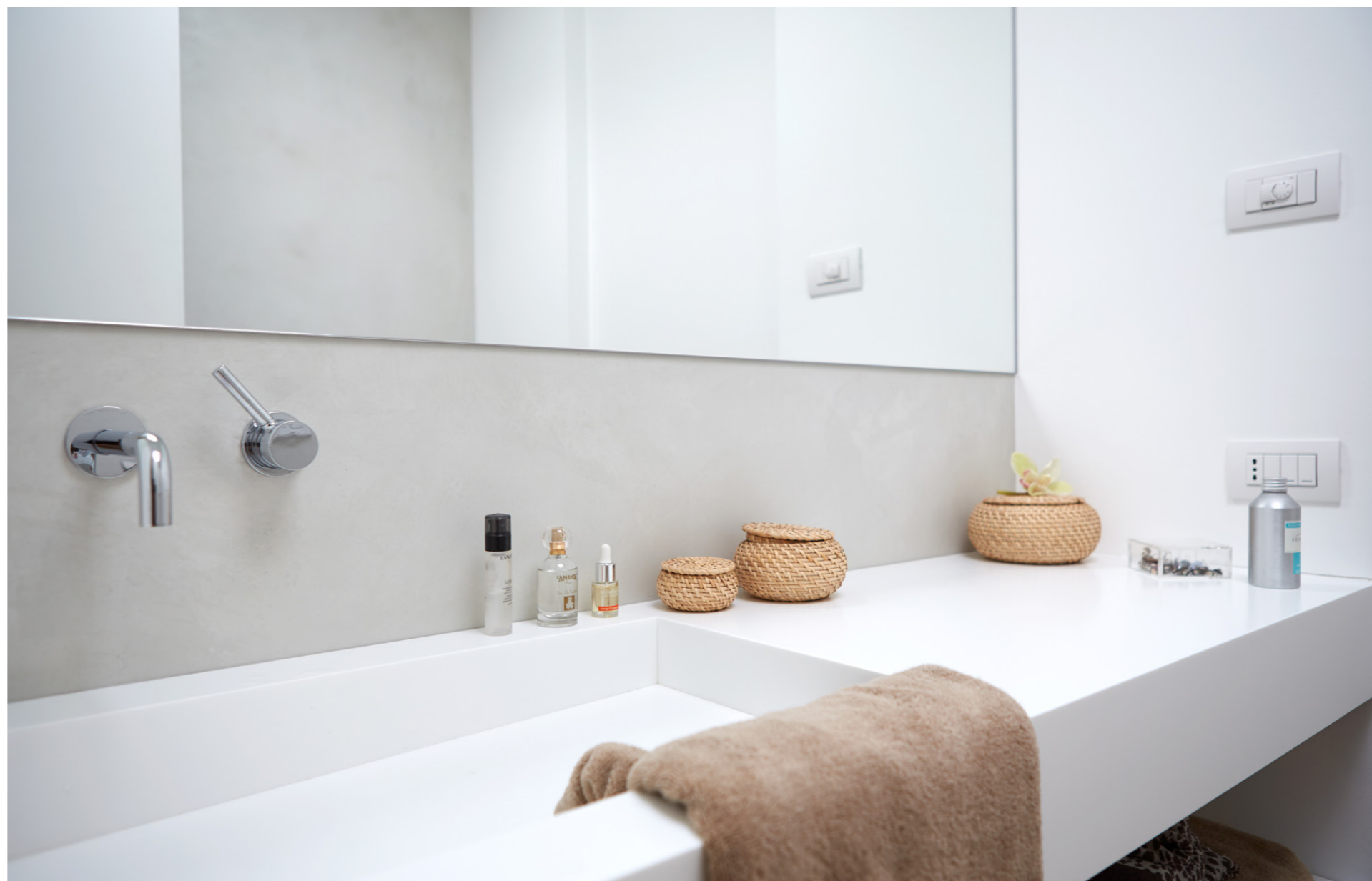
Private Villa 2015. Italy