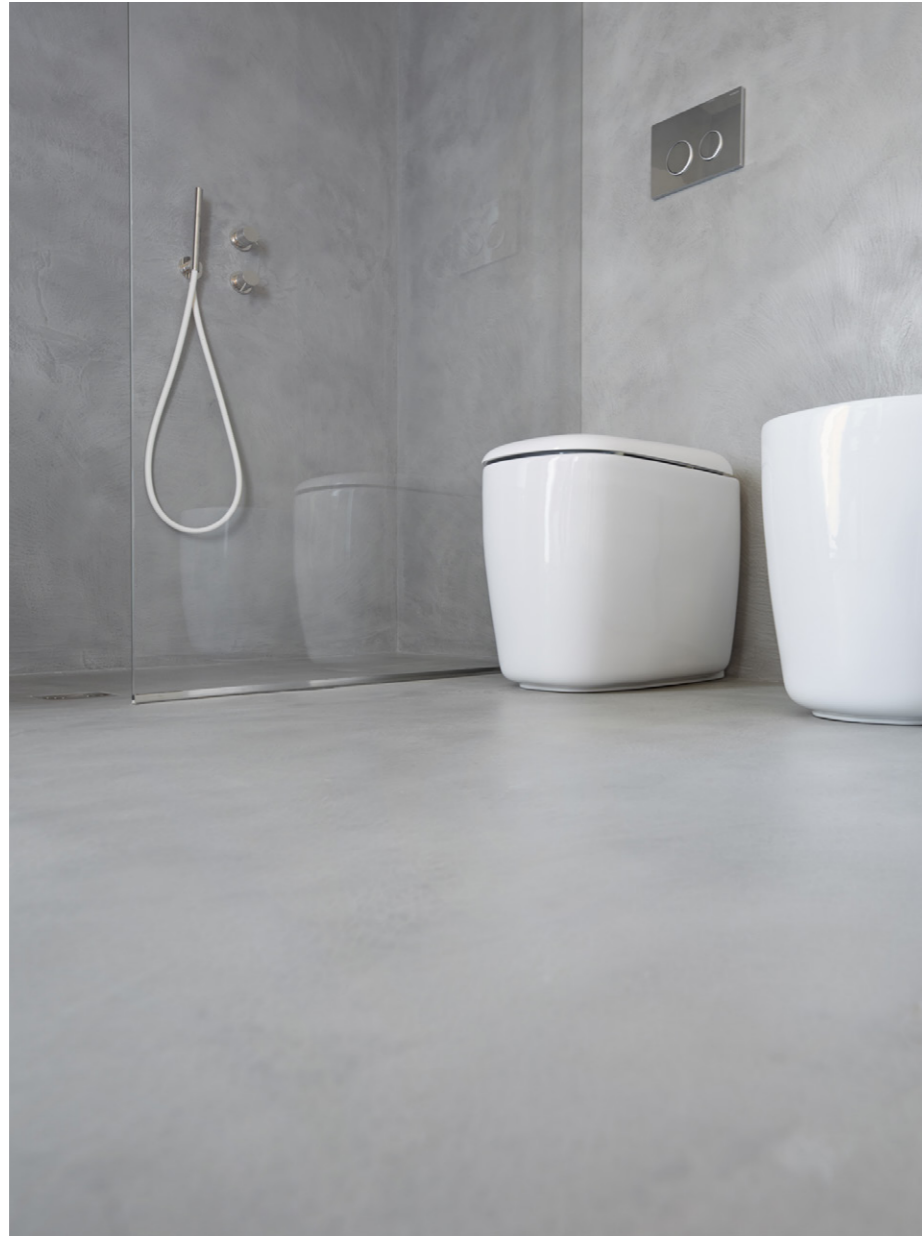
Private Villa 2015. Italy