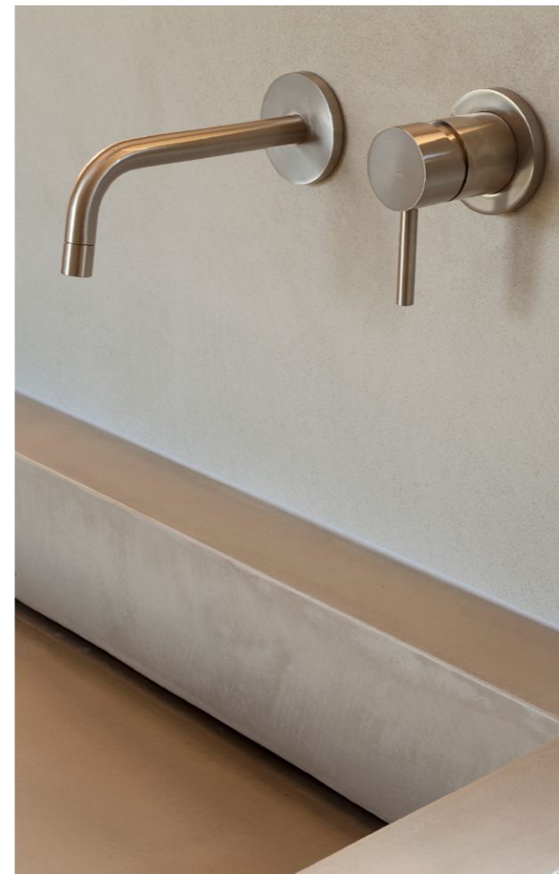
Private Villa 2017. Northern Italy