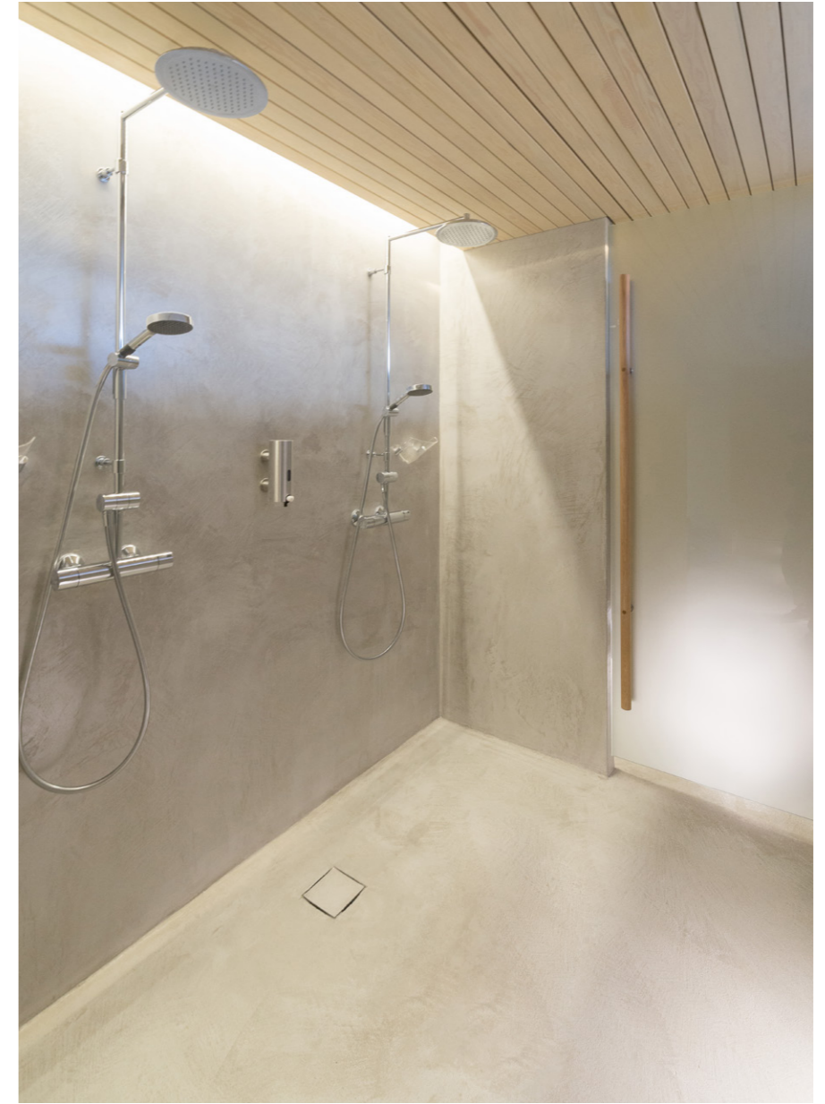
Sauna 2017. Turku, Finland