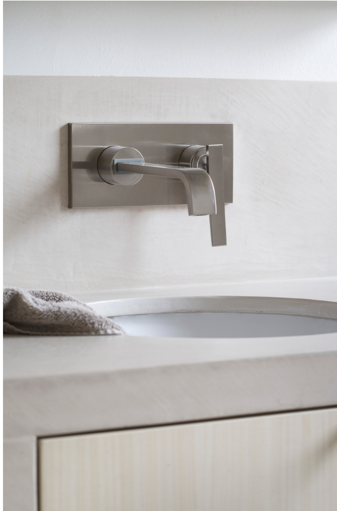
Private Loft 2017. Belgium