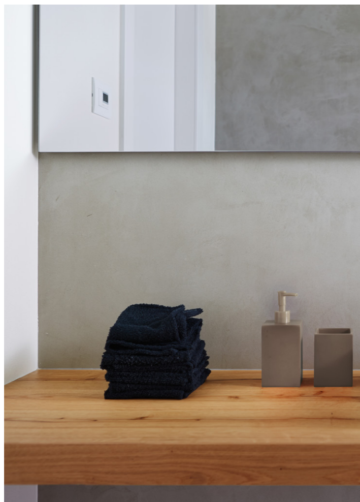
Private House 2014. Northern Italy