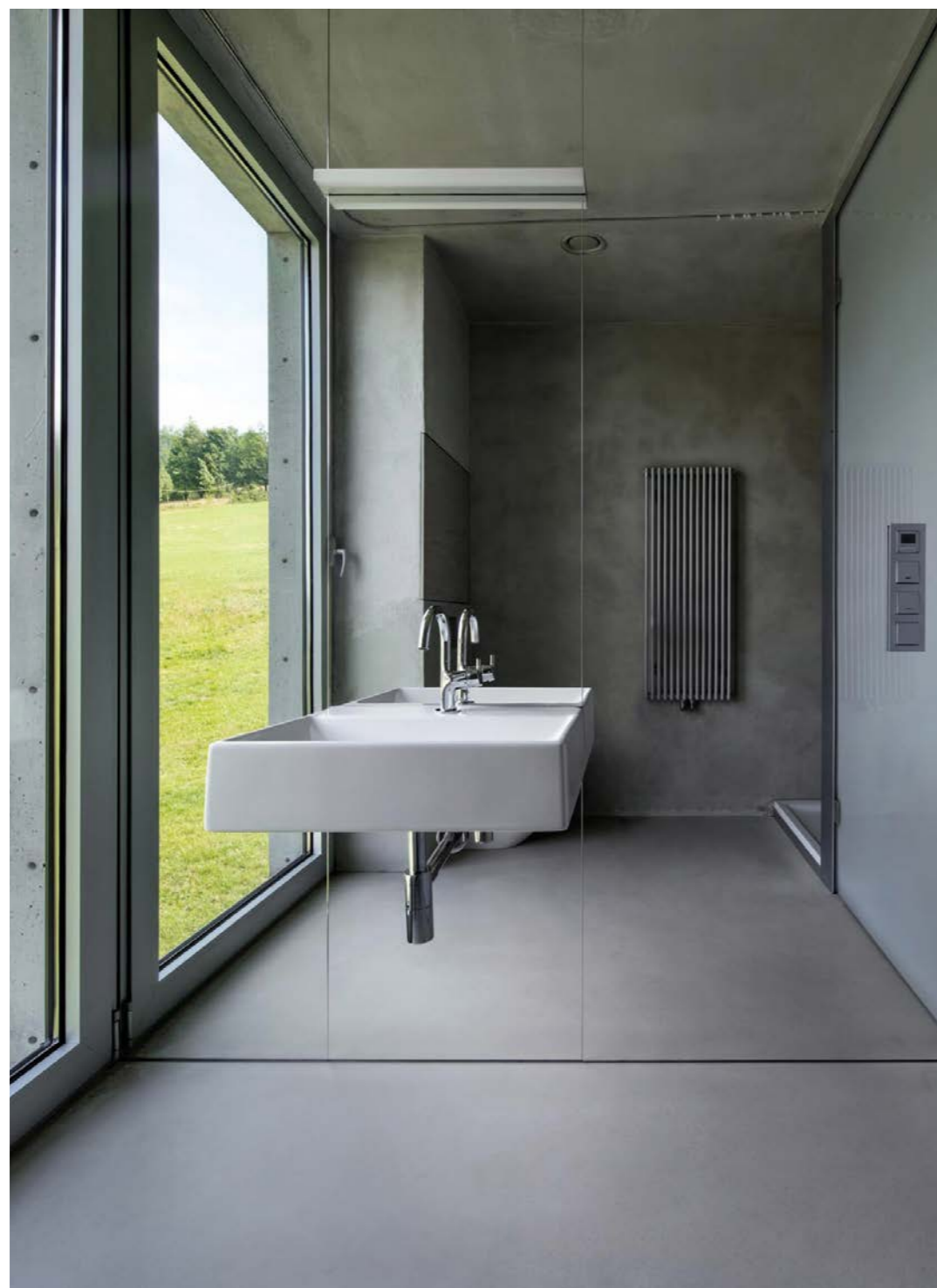
The Ark 2017. Poland