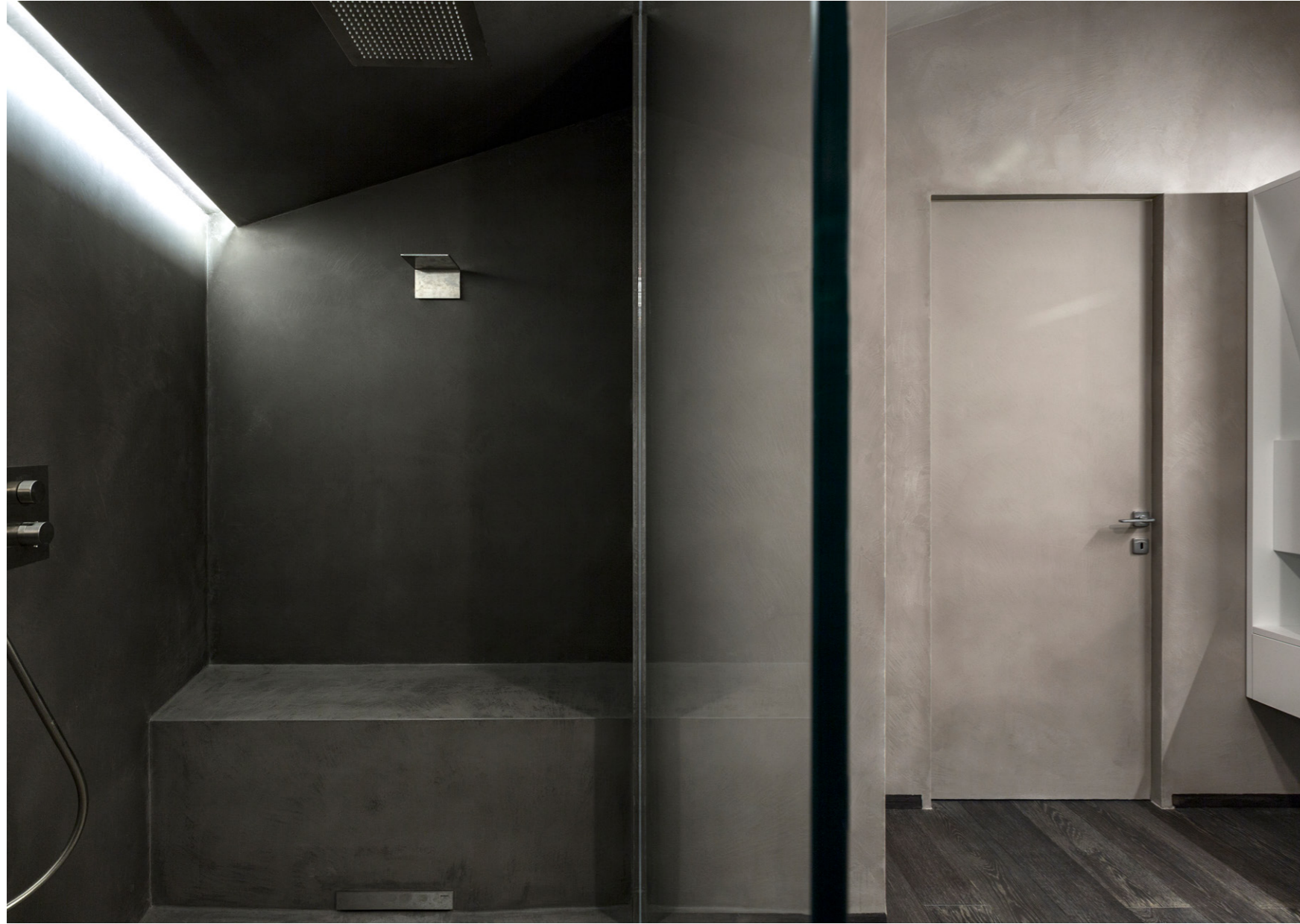
Private Villa 2016. Italy