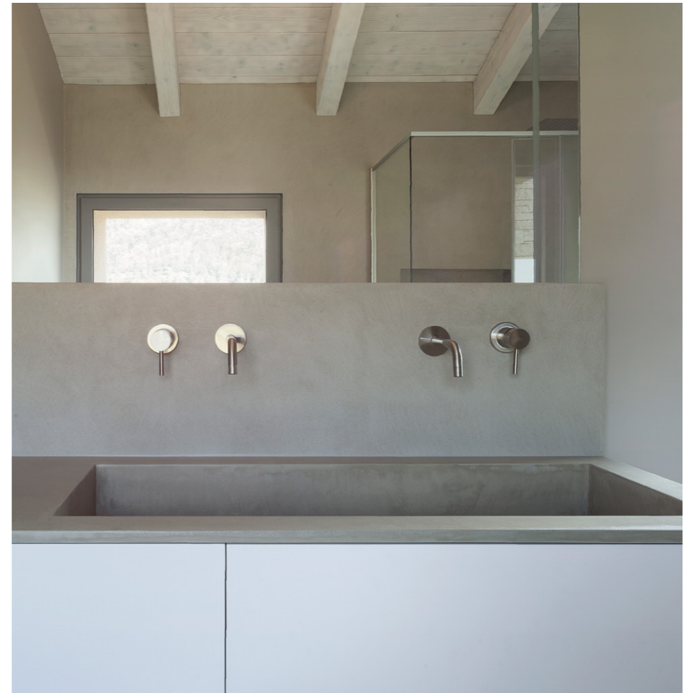
Private Villa 2017. Northern Italy