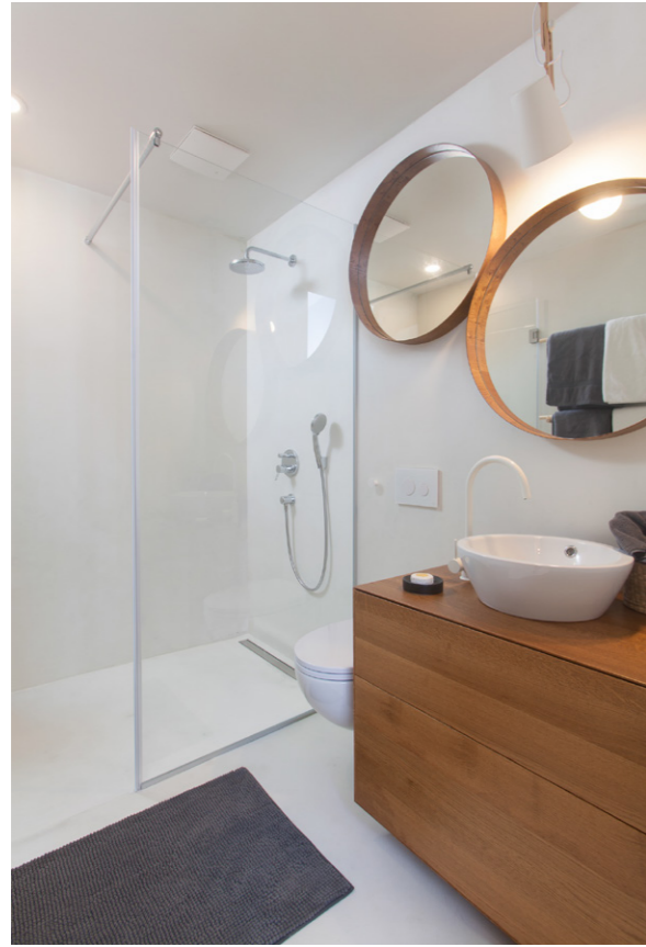
Private Villa 2016. Krk Croatia