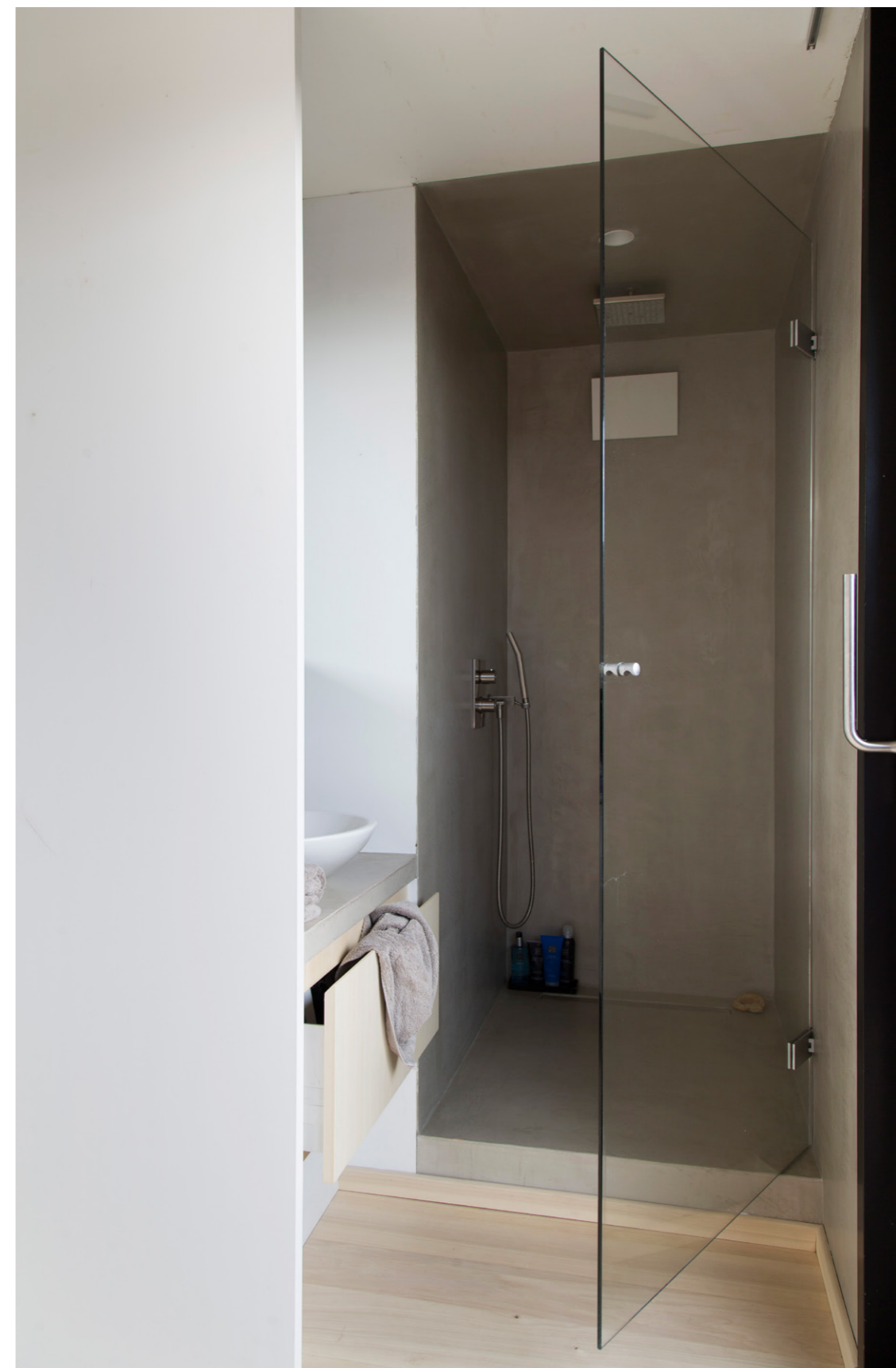
Private Loft 2017. Belgium

Bei einer Stärke von nur 3 Millimetern schafft es Microtopping® bestehende Oberflächen in den unterschiedlichsten Materialien (Beton, Nivellierungsmasse, Keramik, Holz, ...) zu erneuern, ohne dass diese entfernt werden müssen. Microtopping® ist gegen klimatische Einflüsse und gegen Abnutzung extrem widerstandsfähig, leicht zu reinigen und schnell zu verlegen, mit besonders guten Eigenschaften auch bei Böden mit Bodenheizungen.