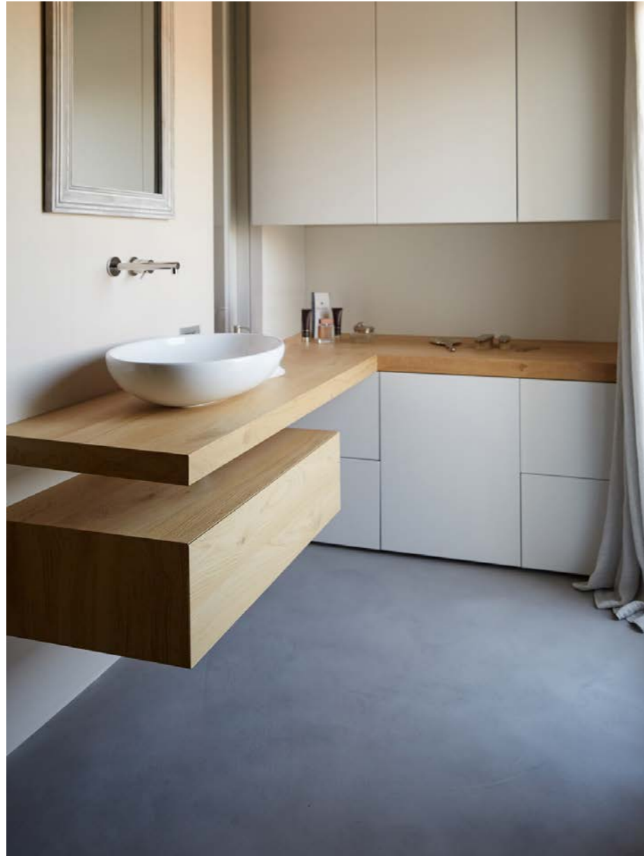
Private House 2016. Italy