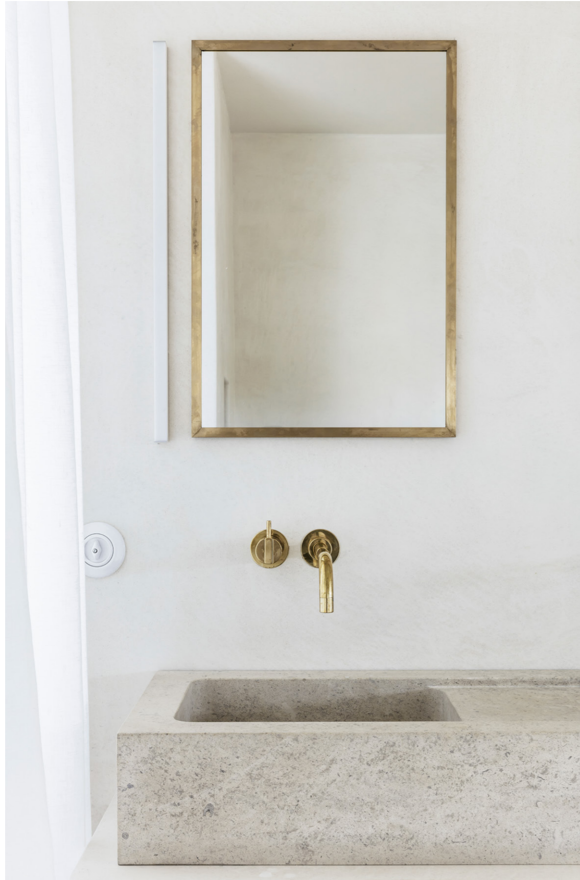
Cube Apartment V-S Kanaal 2017. Belgium