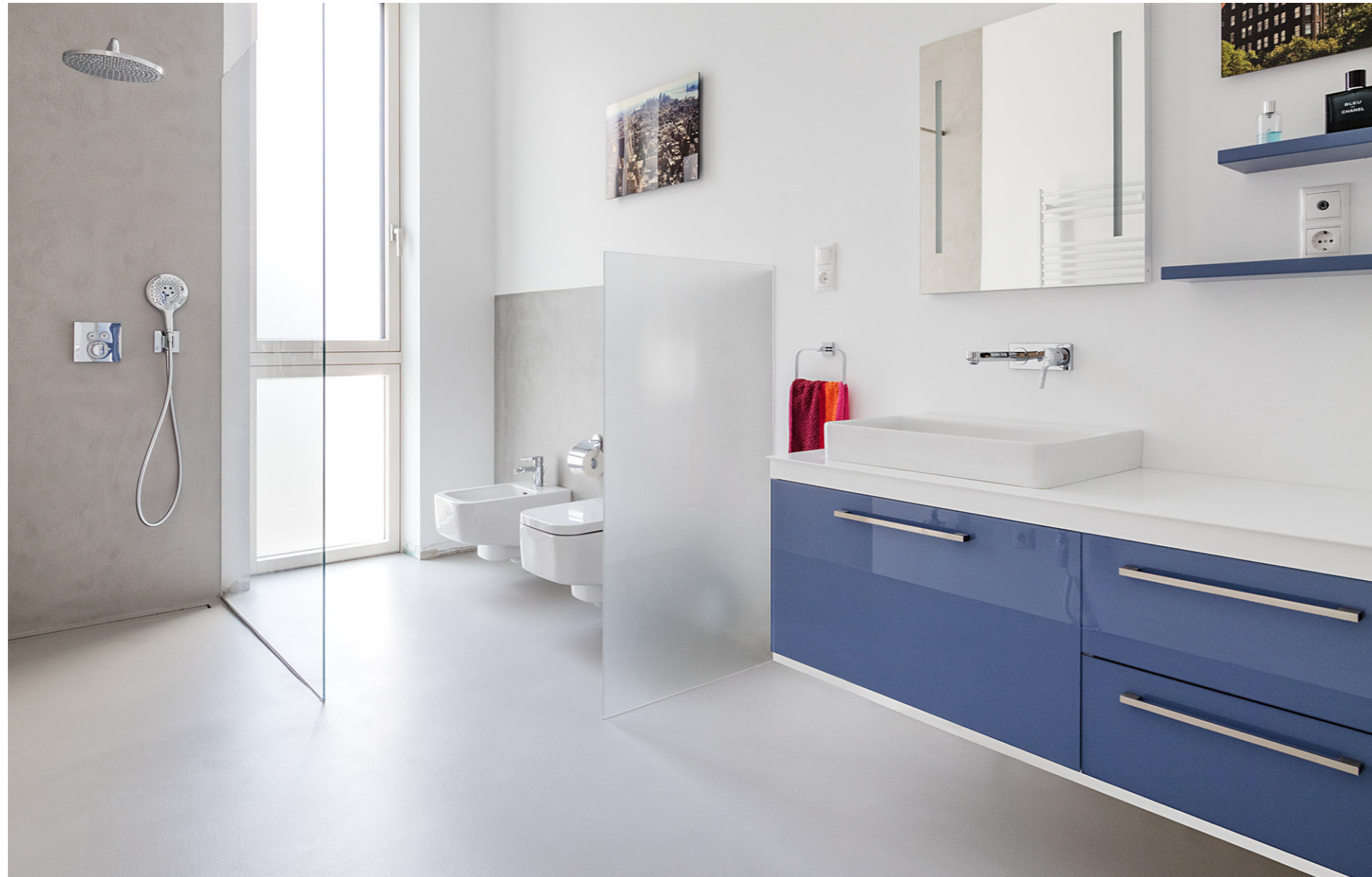
Private Loft 2016. Budapest