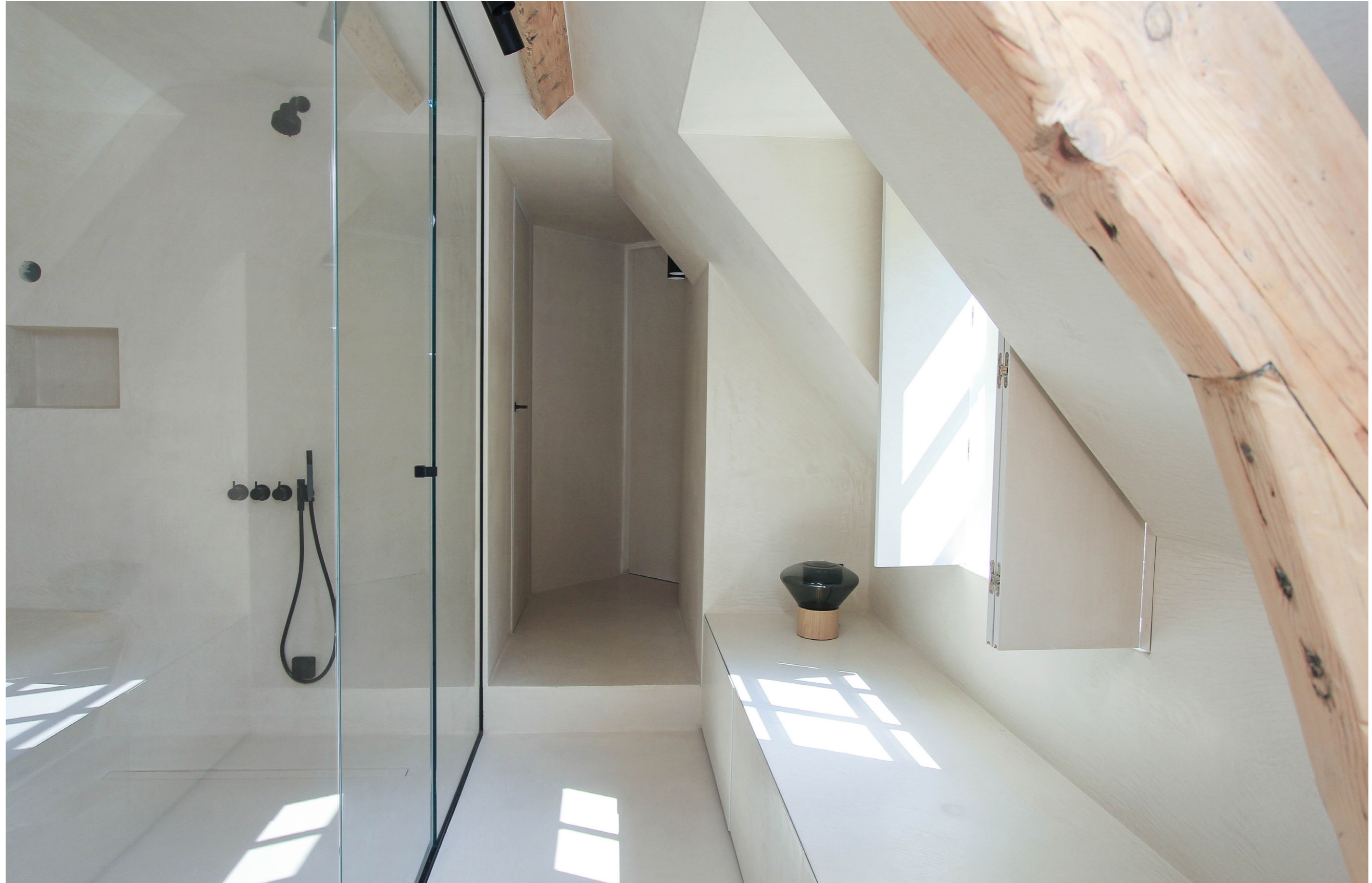
Private Loft 2017. Northern Europe