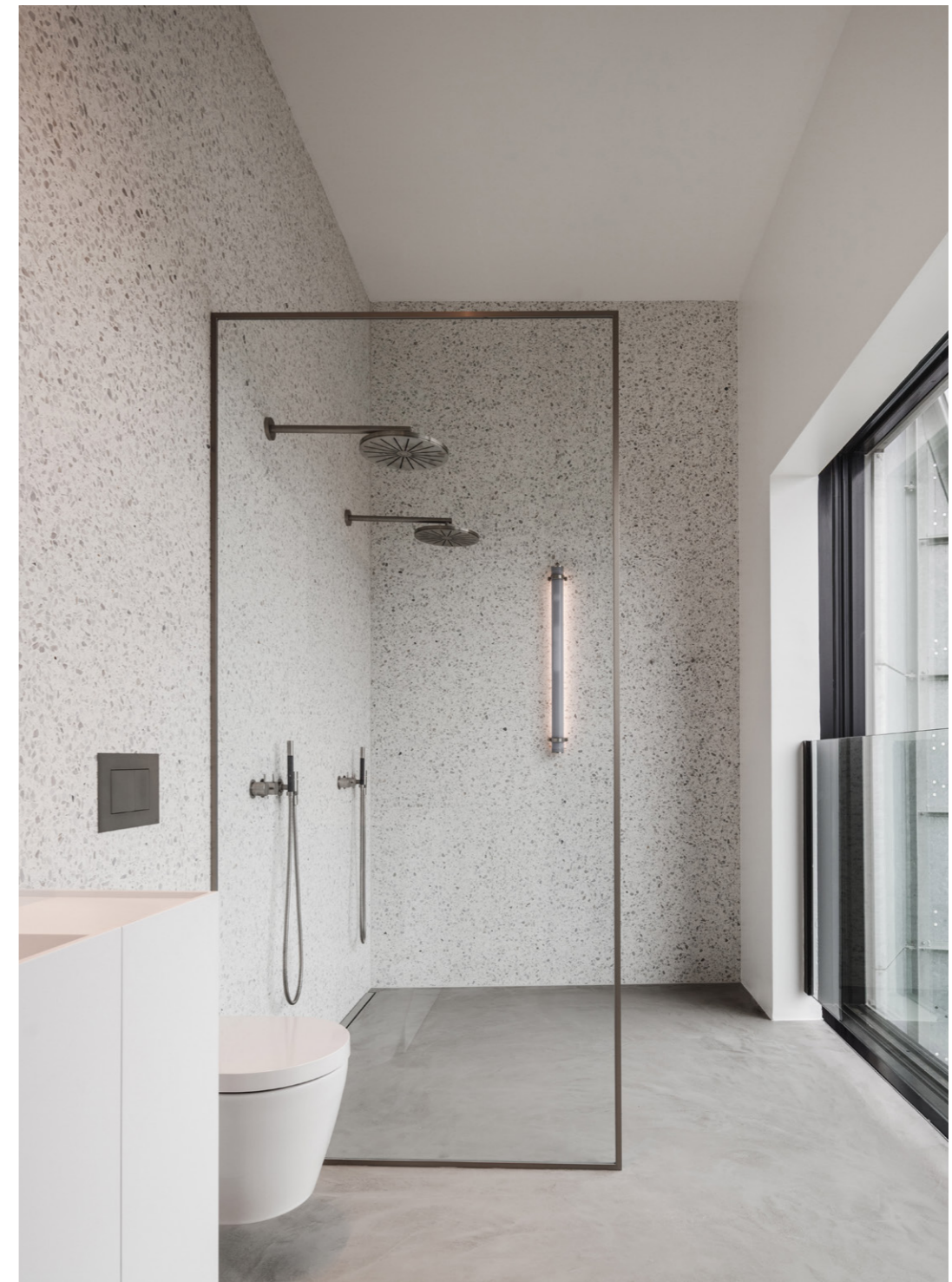
Silo 2017. Copenhagen, Denmark

Ein moderner und raffinierter Raum zur Entspannung: das Badezimmer mit Microtopping® Ideal Work. In nur 3 mm Stärke, beschichtet Microtopping® jede Art von horizontaler oder vertikaler Oberfläche und verwandelt Ihr Badezimmer in einen Raum der Geborgenheit und Entspannung. Microtopping® ist vielseitig und personalisierbar und erlaubt es ein maßgeschneidertes Badezimmer zu schaffen, da sich das Material perfekt den schon bestehenden Flächen wie Holz, Metall oder Keramik anpasst.